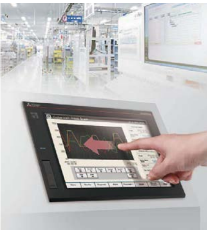
Utilisation facile avec l'écran multipoint