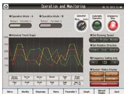
Exemples de projets réutilisables

Les pupitres opérateur GOT2000 offrent 65 536 couleurs et prennent en charge