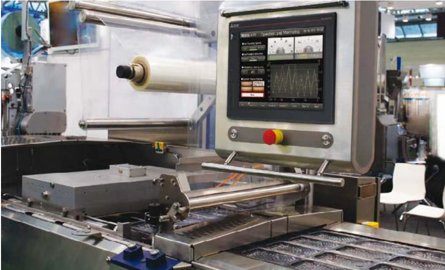
Le pupitre opérateur GOT2000 améliore la transparence de votre production et son rendement