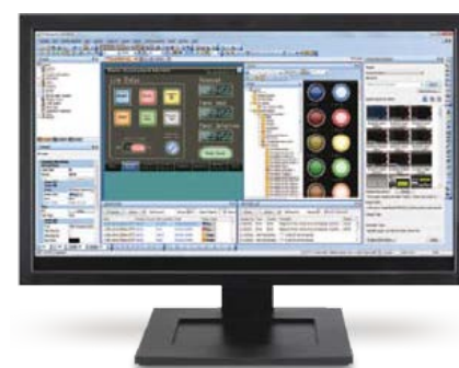
GT Works3 affiche vos écrans réalisés

Les nouveaux écrans GOT2000 sont totalement compatibles avec le logiciel GT Works3 pour la conception d'écrans, avec des fonctions telles que l'utilisation de modèles et d'exemples de projets qui réduisent considérablement le nombre d'opérations lors de la création d'écrans. GT Works3 offre également un ensemble de fonctions, de formes et d'objets courants. Le système d'aide comporte un "Assistant de saisie des appareils" et un assistant de recherche dans les manuels GT Works3.